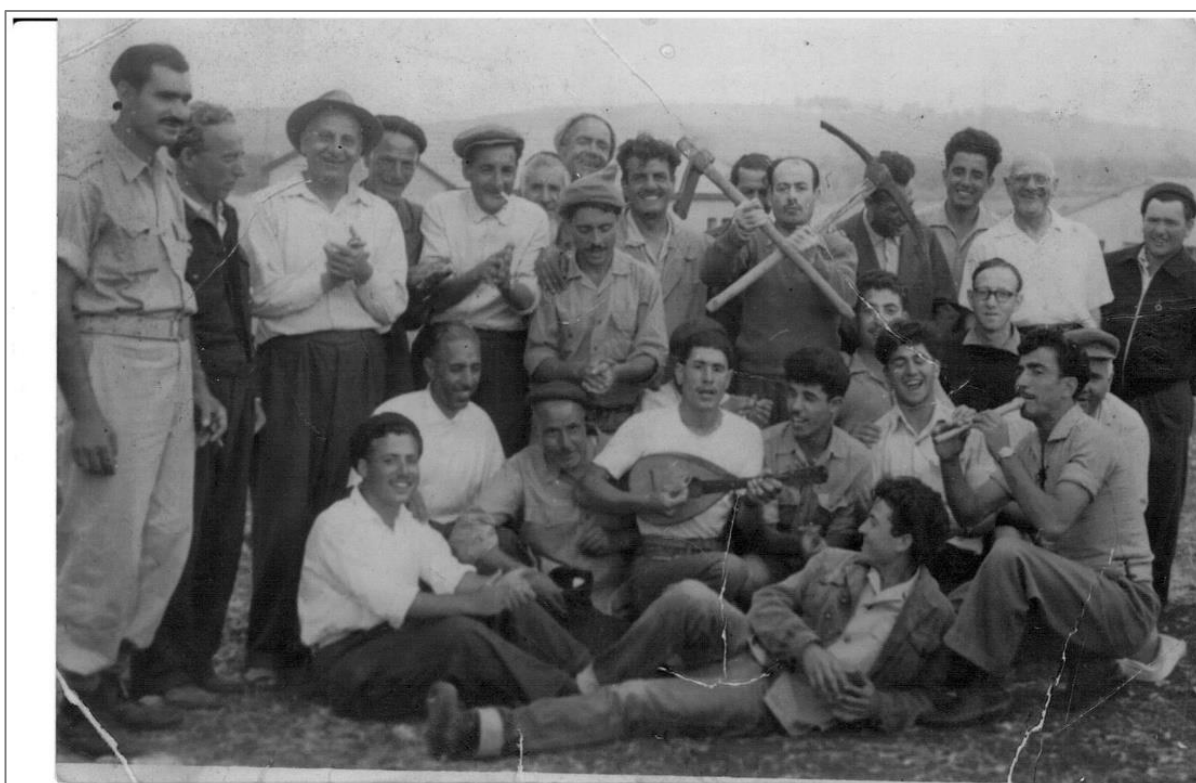
תמונה מספר 3: תושבי חצור שעבדו ב"מטעי האומה".

הקושי בתעסוקה היוזמה לא היה רק במיעוט האפשרויות שעמדו בפני התושבים, אלא גם במאמץ הפיזי שנדרש מהם במשך שעות רבות. 432 מי שעבדו בסיקול או בנטיעת עצים חיכו יום יום על הכביש לרכב שלקח אותם לעבודה המתישה, תמורת שכר נמוך וללא ההילה הרומנטית של "בניין הארץ", אלא במינוח המבזה "עבודת דחק". תמונות מאלבומים פרטיים שלהם מראות אותם לבושים בחולצות לבנות, המעידות עד כמה הייתה עבודת הכפיים הזו זרה להם.