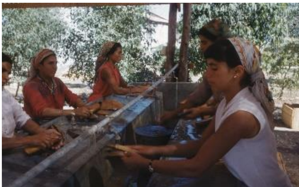
תמונות מספר 6 ו-7: חופרים וחופרות בתל חצור, 1955.