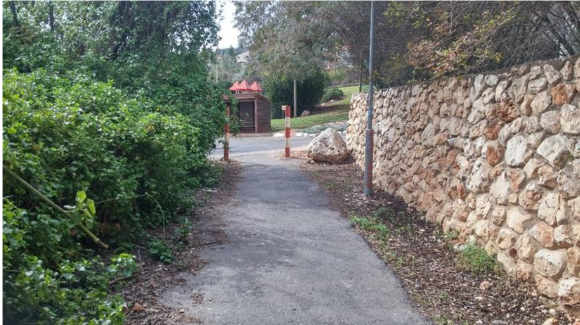
תמונה מספר 1: מחסום בכביש פנימי בין ראש פנה לחצור.

של כעשר דקות יגיע לבית הנמצא ממש קרוב לביתו. כביש גישה טבעי כזה תוכנן ואף תוקצב כבר ב-1951, עוד לפני הקמת חצור, אך ההתנגדות ארוכת השנים של ראש פנה לסלילתו מנעה זאת. יתרה מכך, ב-1986 נטעה ראש פנה עצי זית במקום שבו תוכנן הכביש, ובמרכז דרך העפר הונחו מחסומי בטון שהוחלפו אחר כך בעמודים קבועים. 4 הדבר קיבע את הניתוק בין היישובים. הכביש הנעדר מבטא בידול סמלי, שלדעת פוקו מייצג קו שבר, 5 מצב שבו משני צדי ה"גבול" שוכנות קבוצות שונות שיש להן מערכות התייחסות שונות.