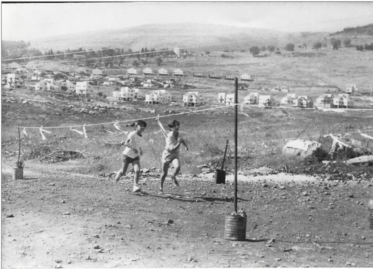
תמונה מספר 4: עירוב מאולתר בחצור אי' (ברקע בתי ראש פנה). הצלם ושנת הצילום לא ידועים

האחרים. הוועד הדתי של חצור אי' נדרש להודיע למשרד הדתות על היקף השטח במטרים, ולהצהיר כי כל ההוצאות על הובלת חומרים ועל עבודות החפירות וחיבור החבלים יהיו על חשבוננו. 576 להבנת, תושבי השיכונים האחרים בנו לעצמם עירוב מאולתר.