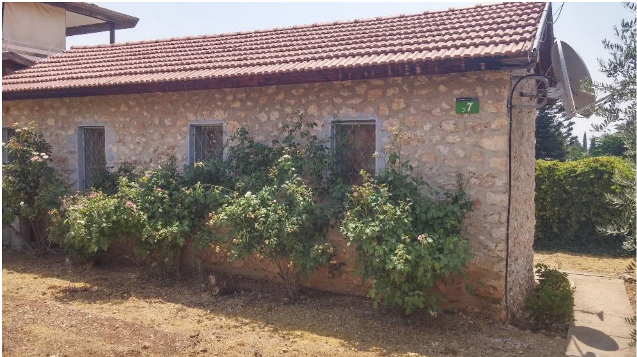
תמונה מספר 2: בית אבן בחצור א'.

מי שמסייר היום בבתים הראשונים של חצור א', הסמוכים מאוד לבתי ראש פנה, יבחין בבתי אבן המשמרים את הצביון האדריכלי המסורתי של המושבה. אלה מעידים כי בשלבים הראשונים של הבניה בחצור א' נעשה ניסיון לשמר את הצביון הארכיטקטוני של בתי המושבה הבנויים מאבן, כדי לשלב בין היישובים.